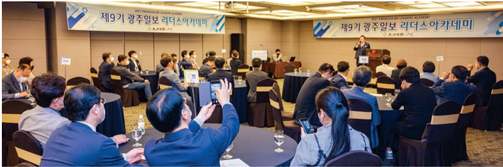
지난 27일 라마다플라자 광주호텔에서 진행된 ‘광주일보 제9기 리더스아카데미’에서 방송인 이용식이 ‘웃어야 장수한다’를 주제로 강의하고 있다.