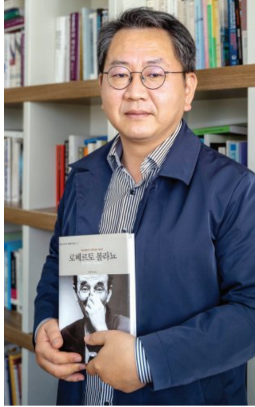
이 교수는 이처럼 볼라노의 작가정신을 높이 평가했다. 아울러 그 또한 중심부 부패와 타락에 반기를 들 수 있는 저항정신이 사회를 건강하게 만드는

그는 볼라노의 영향으로 21세기 한국 문단에서도 젊은 작가들이 주류 문학에 적극적으로 저항하는 문학운동을 전개했다고 설명했다. 중남미 문학 번역본 자체가 드물었던 20년 전만 해도 이렇게 다양한 문학사조가 생겨나기는 어려웠을 거라는 예