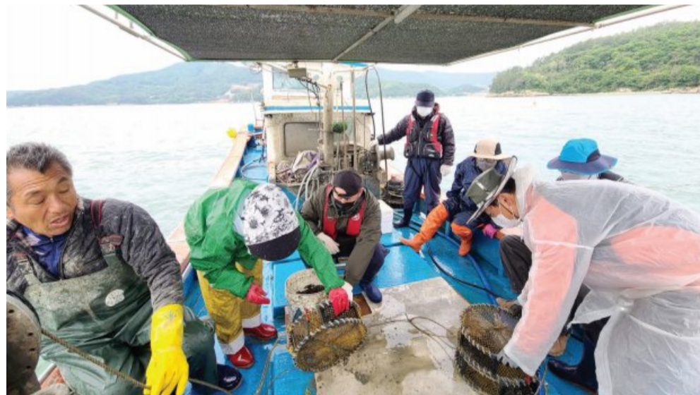
지난 10일 여수 안포어촌을 찾은 도시민들이 어민들과 함께 낚시 통발 작업을 하고 있다. 이들은 13일까지 안포에서 머물며 어촌 생활을 체험하게 된다. <전남귀어귀촌지원센터 제공>

방역 수칙을 철저히 준수하면서 어민들과 함께 맨손어업, 통발, 양식어업 등을 체험하게 된다.