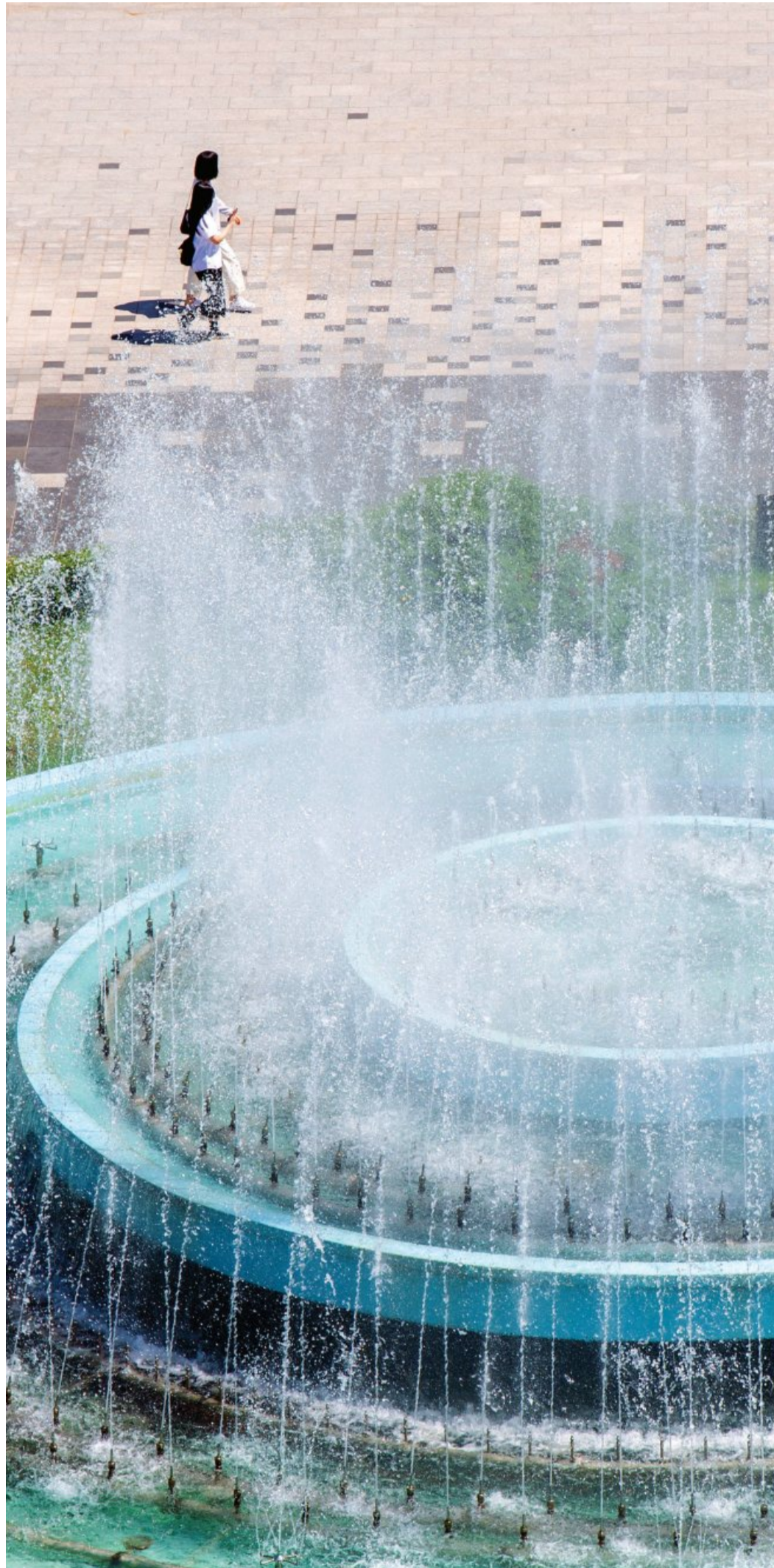
광주 33도 ... 시원한 분수

광주 낮 최고기온이 33도를 기록하는 등 올들어 가장 더운 날씨를 보인 8일 오후 동구 금남로 5·18광장 분수가 시원스레 물을 뿜어내고 있다.