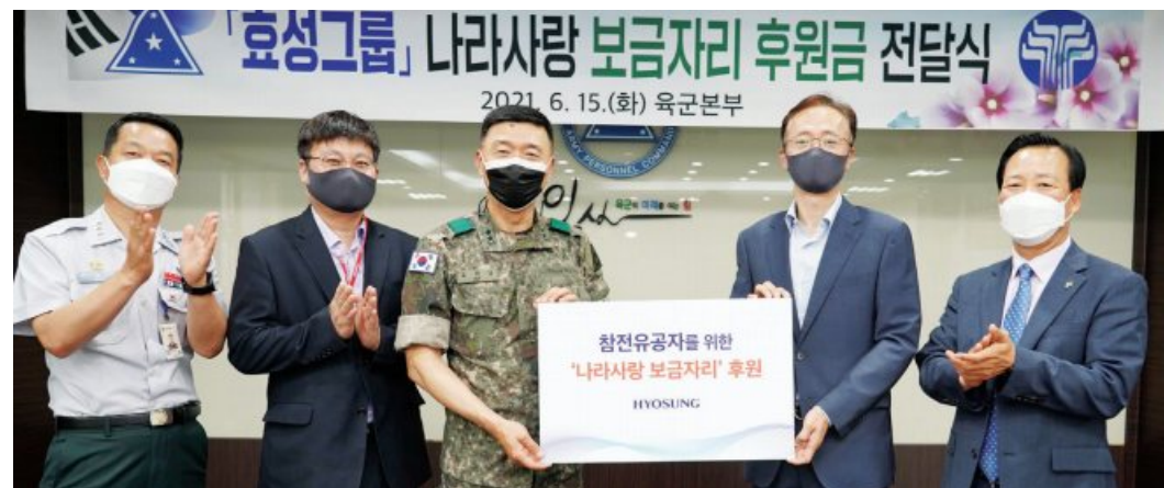
‘효성그룹 나라사랑 보금자리 후원금 전달식’ 2021. 6. 15 (화) 육군본부