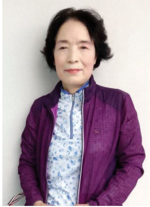
는 듯한 절망감에 휩싸인 적도 있었다. “어동생에게 형제를 맡아 달라고 유언을 하기도 할 만큼 힘들었지만” 그러나 삶을 포기할 수 없었다. 그때부터 어렵פות이 문학을 생각했던 것 같다.

“인생이란 ‘붓’을 들고 무엇을 그려야 할지 고민했죠. 지구라는 아름다운 별에서 두발로 서서 글을 쓸 수 있는 행운을 갖게 해달라고 마음속으로 빌었습니다. 그리고 마침내 문학은 식탁했던 제 인생에 빛을 비추주었구요.”