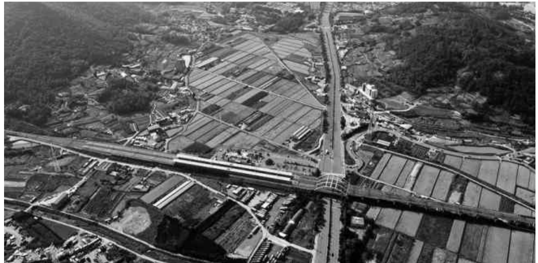
여수 여천역 일대 개발 예정지역.