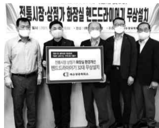
여수상공회의소 회장단이 지난 25일 여수공정장협의회 회장 등과 함께 여수수산물시장 방문해 핸드드라이어기를 설치하고 기념촬영을 하고 있다.

여수상의는 오는 7월3일 진남·쌍봉·제일시장, 9일 서시장·서시장주변시장에서 시장 이용객들을 위한 휴대용 장바구니 카트 나눔 캠페인을 개최한다.