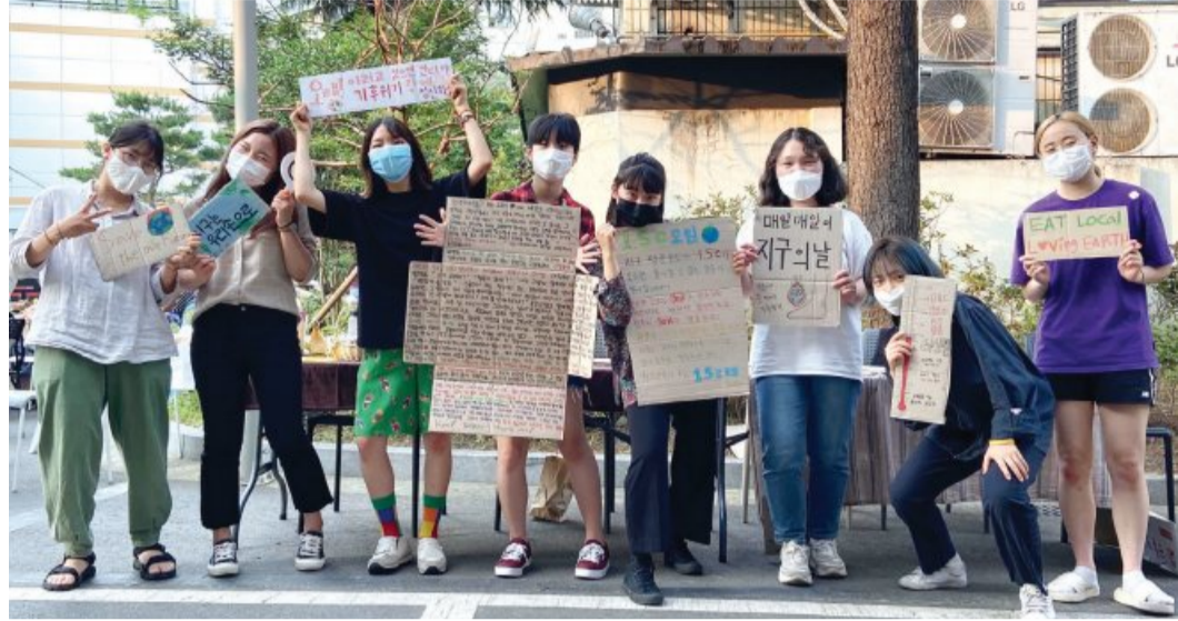
광주 삶디자인센터 청소년 동아리 '1.5도씨' 회원들이 기후 위기를 경고하는 팻말을 들고 피켓 시위를 하고 있다.