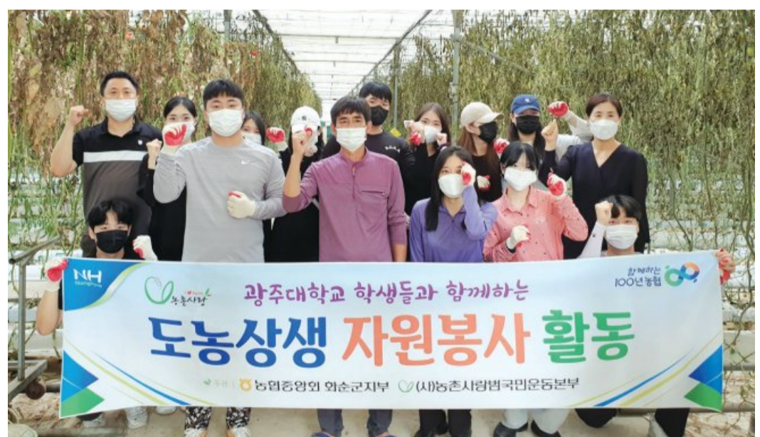
광주대학교(총장 김혁중) 호심 사회봉사단은 지난 28일 화순군 대곡리 토마토농장을 찾아 농촌일손 돕기 봉사활동을 펼쳤다.