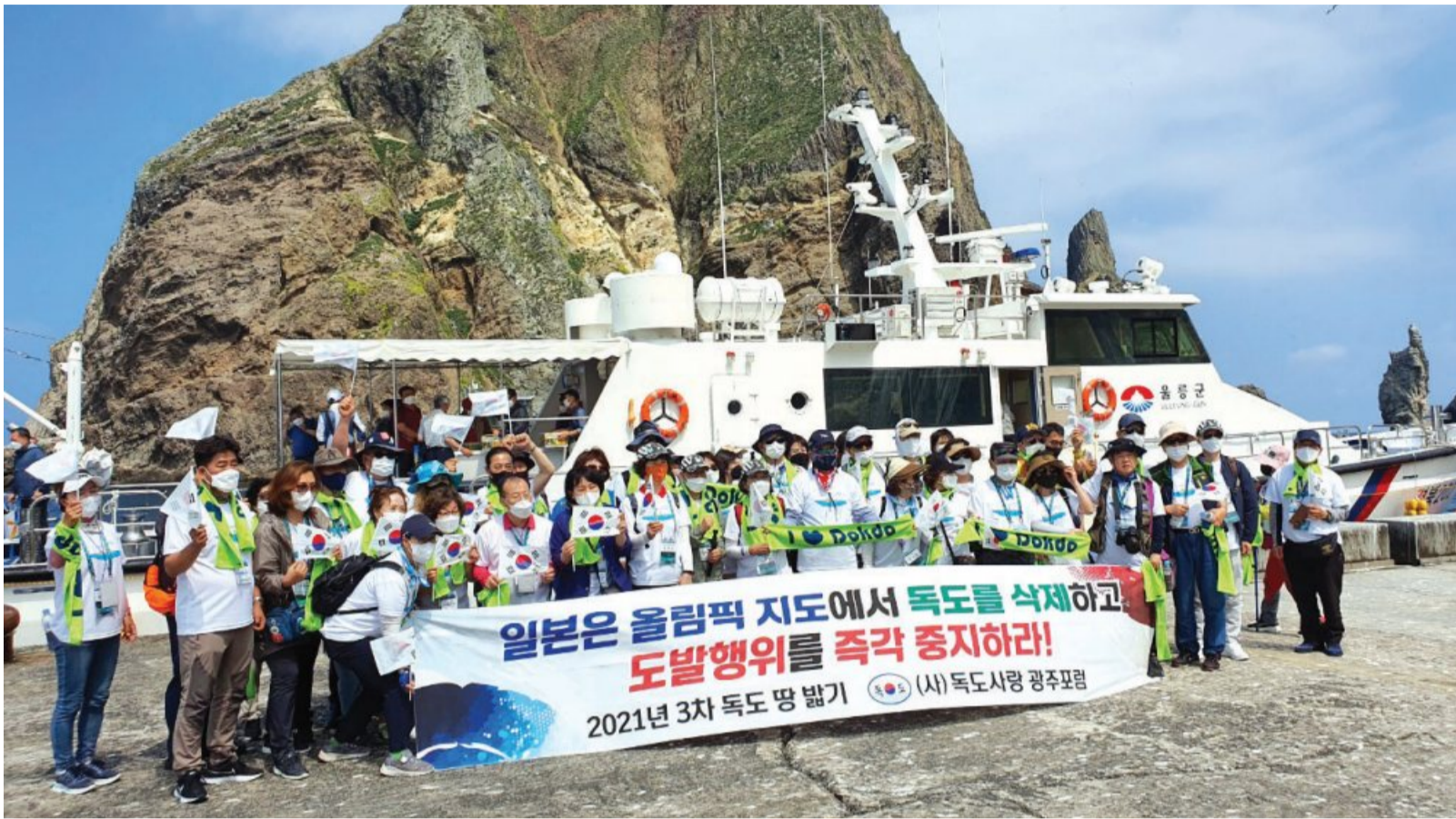
(사)독도사랑광주포럼 회원들이 독도에서 '독도 땅밋기 행사'를 열고 일본을 향해 올림픽 지도에서 독도를 삭제할 것을 요구하고 있다.

이어 “공정한 스포츠 정신을 내세운 IOC는 올림픽 정신을 훼손하는 어떤 행동도 용납해서는 안된다”면서 “독도는 대한민국의 고유 영토로 일본의 경계망동으로 결코 실질을 뒤엎을 수 없는 만큼 역