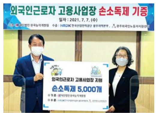
외국인근로자 고용사업장 손소독제 기증 일자: 2021. 7. 7. (수) 외국인근로자 고용사업장 기증 손소독제 5,000개 주최: (재)한국능력개발원 주최: 한국산업인력공단 광주지역본부, (재)한국능력개발원