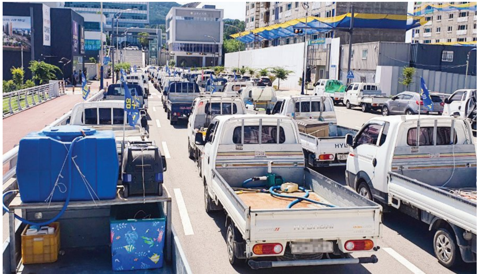
13일 오후 고흥군 군청앞 도로에서 해창만에서 염수피해를 입은 농민들이 원인규명과 피해보상을 촉구하는 차량시위를 벌이고 있다.

온은 24도에 머무는데다 습도마저 더해져 체감온도는 25도 이상까지 상승, 열대야가 나타날 가능성이 높은 것으로 분석됐다. 폭염경보(일최고기온 35도가 넘는 날이 2일 이상일 때)가 내려진 지역도 증가했다. 13일 광주와 나주, 화순, 담양, 구례, 곡성에 폭염경보가 내려진 가운데 이날 오전 11시를 기해 영광과 함평, 순천, 광양이 추가됐으며 흑산도·홍도를 제외한 모든 지역에 폭염주의보(일최고기온 33도가 넘는 날이 2일 이상일 때)가 내려진 상태다. 기상청은 현재 장마전선은 우리나라를 사이에 두고 동과 서로 갈라져 있는 형태를 띠고 있으며, 이번 주까지 전국에 국지성 소나기가 내리다가 오는 18일 제주와 남부지방을 시작으로 19일 전국 대부분 지역에 비를 쏟은 후 장마가 종료될 것으로 봤다. 기상청 관계자는 “장마의 끝을 판단하는 기준은 기단의 모습으로, 북태평양고기압이 우리나라를 덮는 시기가 장마의 종료”라고 설명했다. 더위는 오는 20일 이후 본격화 될 것으로 보인다. 기상청은 현재의 더위가 한 단계 더 강한 수준의 더위가 될 것이라고 설명했다. 기상청은 13일 개최한 온라인 브리핑에서 “지금의 더위는 한반도 서쪽에 있는 저기압의 가장자리를 따라 뜨겁고 습한 공기가 유입되면서 기온이 오른 것”이라며 “20일 이후 북태평양고기압과 티베트고기압의 영향이 더해지면서 더위가 지금보다 한 단계 더 강해질 것”이라고 예측했다. 다만 2018년 만큼의 무더위가 찾아올지는 정확지 않다. 기상청 관계자는 2018년 폭염은 열돔 현상과 뜨거운 열기가 장기간 더해져서였고, 올 여름 더위는 대기 상층부에 열기가 얼마나 오래 머물러 있는 지에 따라 판가름날 것이라고 설명했다.