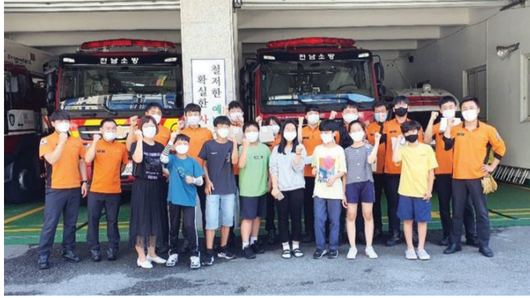
지역 소방서에 직접 재배한 블루베리청 등을 선물한 여수 시전초등학교 학생들.

학생들은 지난 3월부터 학교 곳곳에 상자, 화분 등을 놓고 텃밭을 가꿔 왔다. 텃밭에서는 블루베리 외에도 방울토마토, 고추, 파프리카, 가지, 옥수수, 수박, 참외, 오이, 호박 등 다양한 작물이 자라고 있다. 도움반 학생들이 텃밭 가꾸기에 동참한 건 올해