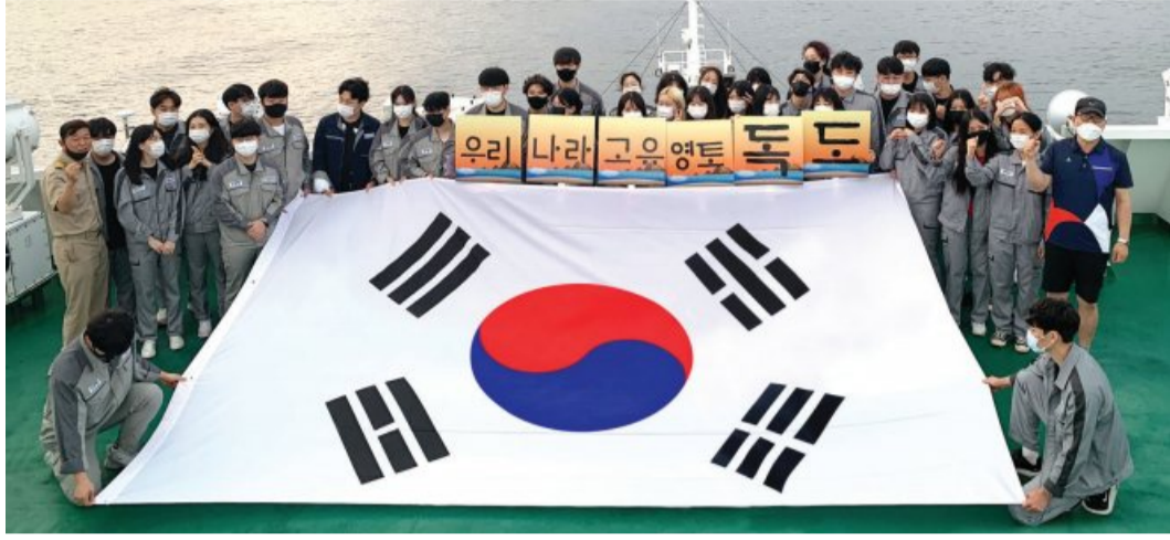
전남대 학생·교직원 등으로 구성된 해양영토 항해실습단이 독도 앞바다에서 태극기와 피켓을 들고 '독도 사랑' 캠페인을 진행하고 있다.

캠프는 김학장이 주도해 기획했다. 본래 해양영토 항해실습은 학생·교직원들이 전남대 실습선인 새동백호에 승선해 동남아 등에서 항해할 등 다양한 선박관련 수업을 받는 교육이다. 다만 코로나19 여파로 국제 실습이 어려워지자, 지난해에 이어 올해도 우리나라 동서·남해안을 도는 교육으로 대체했다. 이준석 수산해양대학 선박실습센터 팀장은 "항해실습 기간 중 우리 고유의 영토인 독도를 올바르게 이해하고, 대한민국 국민으로서 독도 수호 의지와 민족 자긍심을 고취하기 위한 행사"라며 "최근에는 일본이 2020 도쿄올림픽에 앞서 '방위백서'에 독도 영유권 주장을 반복 기술하는 등 도발이 이