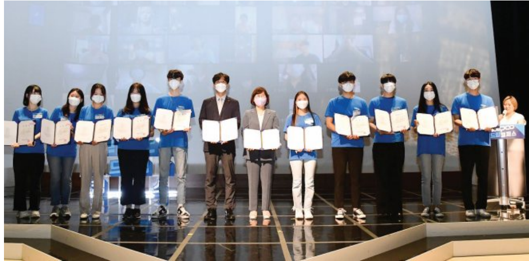
올 여름방학 동안 지역아동센터에서 주 2회 수업을 진행할 '한전 빛드림캠퍼스' 대학생 대표들.

기 보다는 아이들의 '학습플래너' 역할을 하며 올바른 공부 태도와 습관을 길러 줄 생각이다.