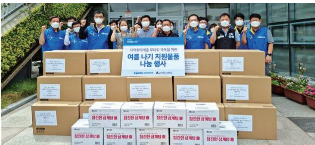
한국철도(코레일) 광주전남본부 사회봉사단이 최근 철도연변 독거노인 및 조손가정 등 50개 가구에 선풍기와 식료품·마스크·온누리상품권 등 무더위 극복 후원물품을 전달했다.