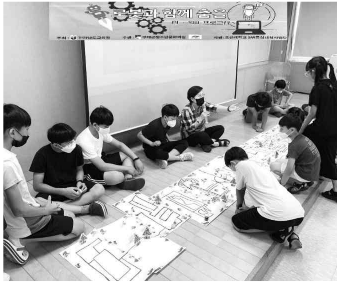
조선대 SW중심대학사업단, 구례군 청소년 AI·SW 코딩캠프

에 대한 설문조사를 실시했다. 연구팀은 “대다수 국립공원들의 운영 프로그램들이 환경보존 형태의 프로그램인데, 이제는 관광객의 편의성을 높인 프로그램도 필요한 시기”라면서 “국립공원의 적절한 개발과 함께 관광객들의 환경 의식을 강화할 수 있는 교육을 병행하는 것도 필요하다”고 제시했다. 호남대 정은성 교수 연구팀은 제3차 국립공원 타당조사 적합성평가 이외에도 제7차 전남권 관광개발계획 수립, 남해안 해양휴양 관광벨트 조성, 광주시 관광산업 진흥을 위한 관광수용태세 개선방향 연구 등을 수행하면서 지역 관광개발의 지속가능성을 위해 생태환경의 보존과 개발의 공존에 대한 연구논문을 활발하게 진행·발표하고 있다. /채희중 기자 chae@kwangju.co.kr