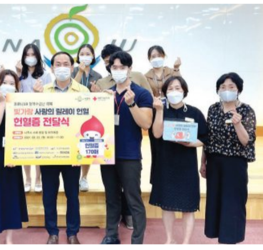
남혈액원을 통해 지역으로 전달될 예정이다. 또한 참여기관 임직원을 대상으로 모금 받은 170장 헌혈증은 나주시 희망복지지원팀을 통해 23일 전달했다. 전달된 헌혈증은 향후 나주시 소재 종합병원 및 의료기관 내 긴급혈액이 필요한 지역민에게 기부될 예정이다.

이번 헌혈 캠페인은 지난해 콘진원이 주도적으로 추진해 올해도 2년째 이어져 온 사회공헌 활동의 하나다. 올해는 지난해 보다 헌혈 캠페인에 동참하는 기관이 늘어나 콘진원을 비롯해 농림식품기술기획평가원, 사립학교교직원연공금단, 한국농수산식품유통공사, 한국문화예술회관연합회, 한국방송통신전파진흥원, 한국인터넷진흥원, 한국전력거래소, 한전KDN 등 9개 공공기관 임직원 399명이 동참했다. 캠페인 기간 수급된 혈액은 대한적십자사 광주전