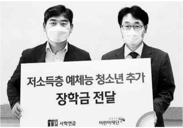
한편 사학연금은 지난해 6월부터 초록우산어린이재단 “TP희망나눔기금”을 통해 예체능 분야에 재능이 있으나 꿈을 실현한 기회가 부족한 저소득 가정 아동 4명에게 지역인재양성 장학지원사업을 진행하고 있다.