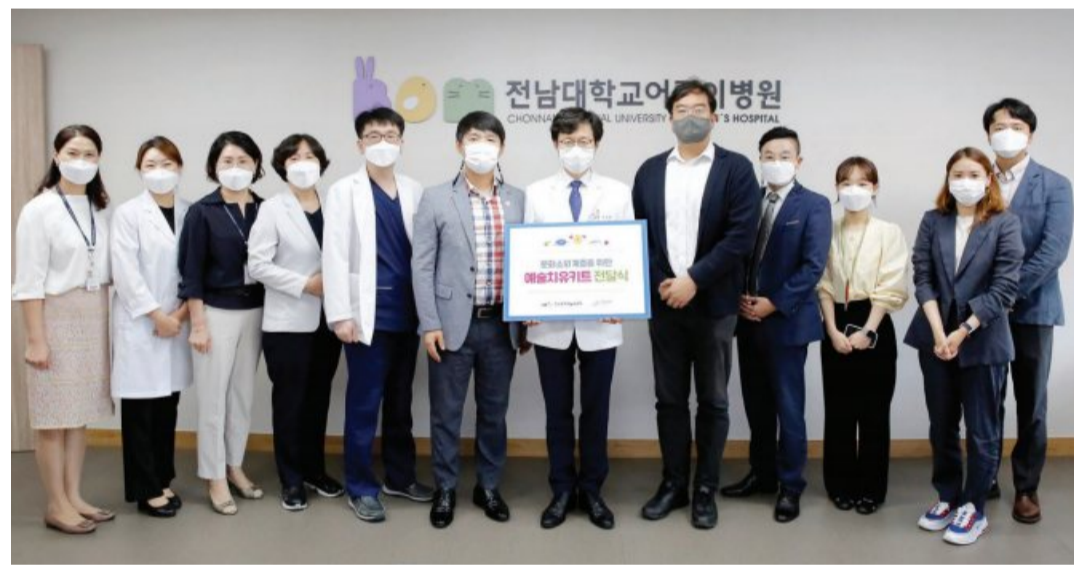
굿네이버스 광주전남지역본부(본부장 배준열)와 한국문화예술위원회(위원장 박종관)가 최근 전남대 어린이병원에 예술치구키트 50개를 기증했다.