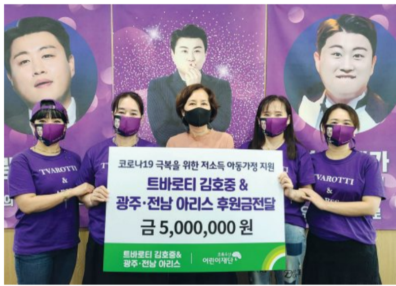
가수 김호중 팬클럽 '광주-전남 아리스'가 초록우산어린이재단에 후원금 500만원을 전달했다. <사진> 팬클럽 회원 일동은 “어려운 형편에도 가수의 꿈을 이룬 김호중 가수처럼, 경제적 어려움을 겪고 있

가수 김호중 팬클럽인 '광주-전남 아리스'가 최근 코로나19 장기화로 어려움을 겪고 있는 저소득 아동가정을 지원하기 위해 초록우산어린이재단 광주지역본부(본부장 김은영)에 후원금 500만원을 전달했다. <사진> 팬클럽 회원들은 김호중의 첫 정규앨범 '우리家' 앨범 발매 1주년을 기념하기 위해 자발적으로 나눔에 동참해 후원금을 모았다. 또 공동생활 가정에 거주 중인 아동을 위한 수제비누 200개를 함께 전달했다. '광주-전남 아리스' 회원들은 올 초 KF94마스크 5000장, 라면 118박스, 김호중 클래식 앨범과 우리家 앨범 각 100장씩 등 생필품을 도움이 필요한 소외계층들에게 전달하기도 했다. 팬클럽 회원 일동은 “어려운 형편에도 가수의 꿈을 이룬 김호중 가수처럼, 경제적 어려움을 겪고 있