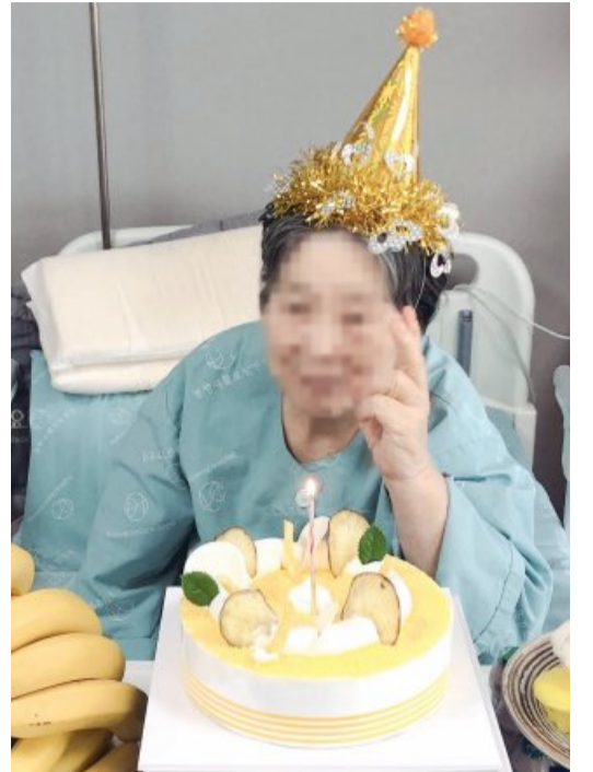
병원 임직원들은 어르신 생신 잔치를 열어주며 코 로나19로 인한 환자의 외로움을 달래고 있다.