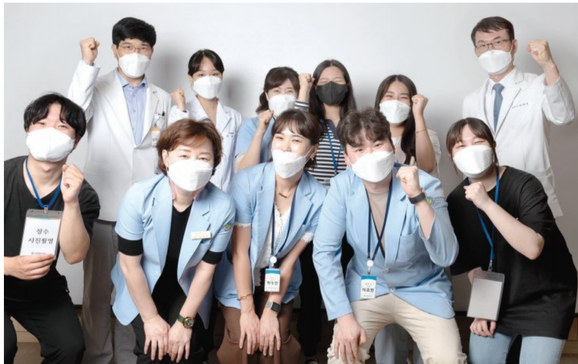
'비대면 만남'을 열고 방역수칙을 철저히 지킨 결과 모든 환자와 임직원이 코로나19로부터 안전을 지킬 수 있었다.