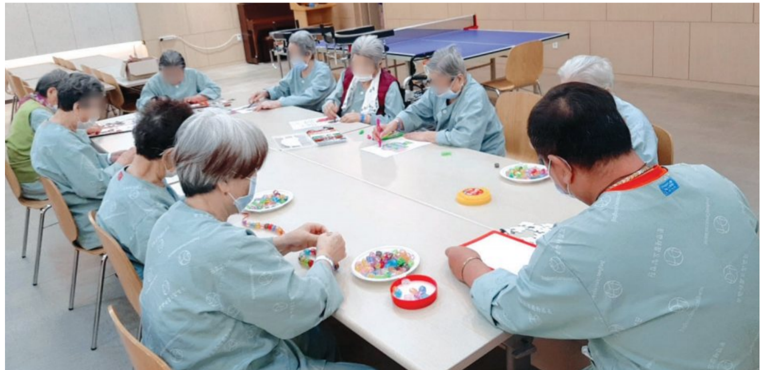
동행재활요양병원은 의료 치료 외에도 다양한 재활 프로그램을 마련해 환자의 회복을 돕고 있다.