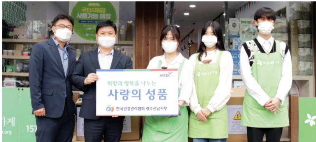
한국건강관리협회 광주전남지부는 28일 캠페인을 통해 전 직원이 모은 헌옷과 패션잡화를 아름다운가게 운천점에 기증했다. 이번 행사는 협회 창립 57주년을 기념, 지역사회 나눔을 실천하기 위해 진행됐다.