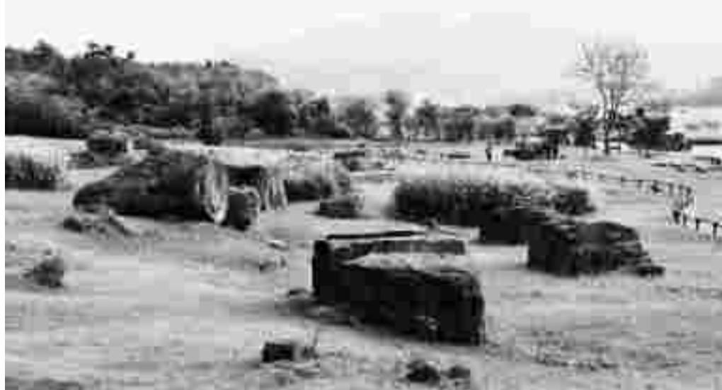
세계문화유산 고창 고인돌 유적.