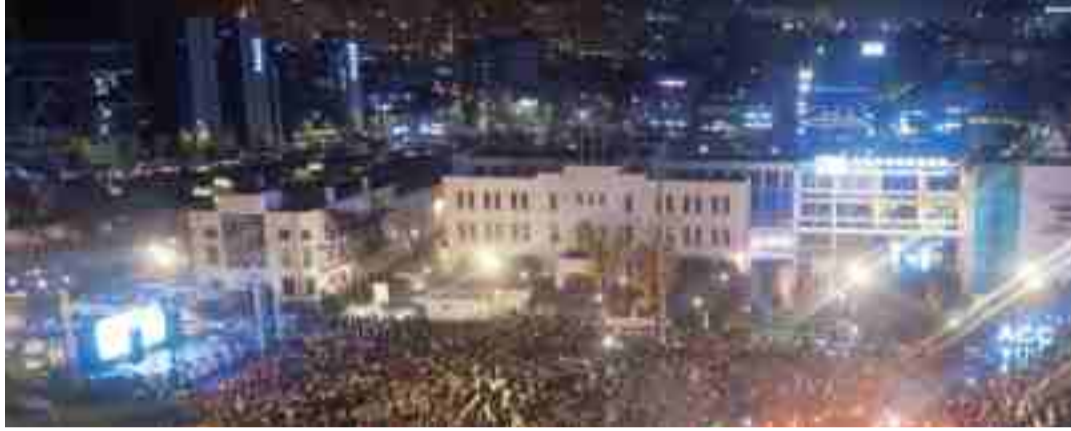
옛 전남도청 앞 광장에서 열린 박근혜 퇴진 촛불시위(2016).

박근혜 퇴진 촛불시위 등 40여점...31일까지 전일빌딩 245 “재개발 등 광주의 사라지고 아픈 구석 계속 찾아 다닐 것”