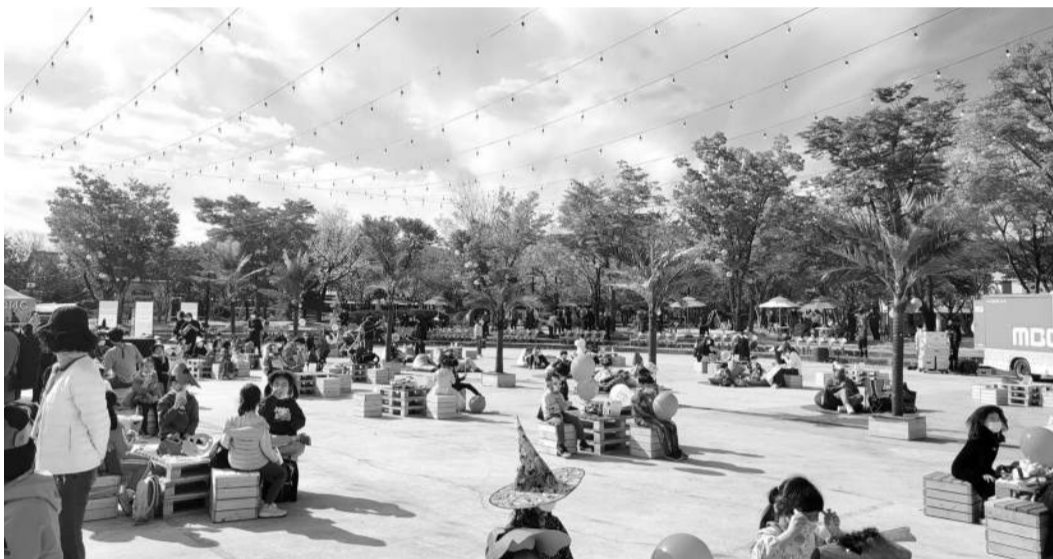
심청 축제를 개편한 어린이 대축제가 지난날 29~31일 섬진강기차마을에서 성황리에 개최됐다.

곡성군이 코로나19로 인해 지난해 개최하지 못한 심청 축제를 어린이 대축제로 개편해 올해 성공적으로 개최했다.