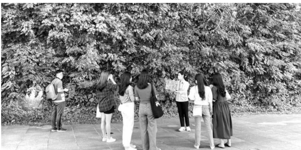
ACC는 오는 6일부터 27일까지 민주평화교류 권역을 투어하며 아시아문화를 체험하는 프로그램을 운영한다.

국립아시아문화전당(ACC·전당장 직무대리 이용신)은 '한국인이 꼭 가봐야 할 관광지 100선'에 꼽힐 만큼 건물이나 공간 구성이 특이하다. 특히 옛 전남도청이 자리했던 민주평화교류원 일대는 현대사의 상흔이 깃든 의미가 깊은 공간이다. 구체적으로 옛 전남도청 본관, 회의실, 별관, 전남지방경찰청, 민원실, 5·18민주광장의 상부관까지 6개의 보존건물이 해당된다. 이곳은 민주, 인권, 평화의 광주정신이 깃든 곳으로 역사적인 건물과 현대적인 미디어월이 조화를 이루고 있어 ACC의 랜드마크 역할을 하고 있다.