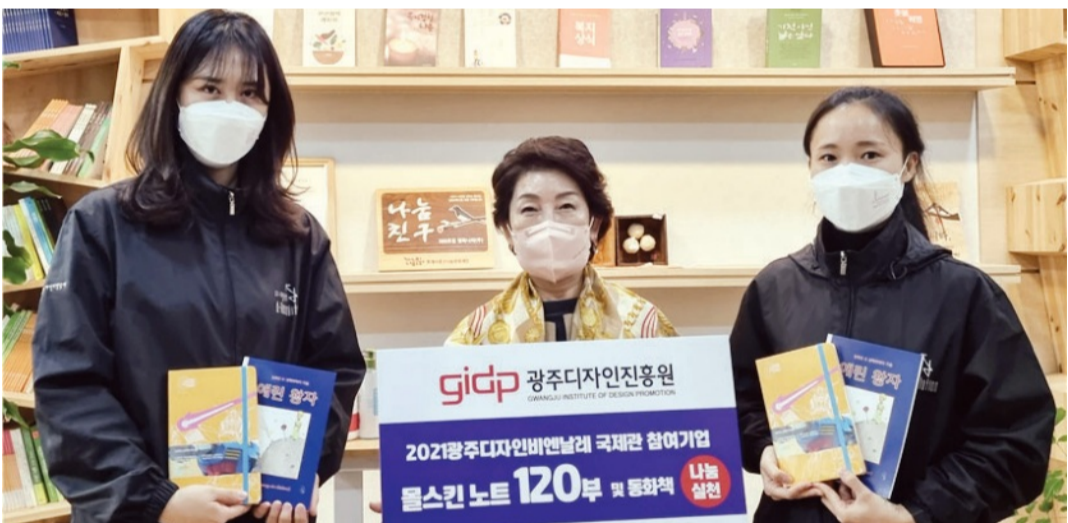
최근 폐막한 2021 광주디자인비엔날레가 이번 행사에서 작품을 선보인 몰스킨, 도서출판 이팝과 함께 기부활동을 펼쳤다. 디자인비엔날레는 최근 프리미엄 라이프 스타일 브랜드 몰스킨이 제작한 ‘건담 에디션 노트’ 120부와 도서출판 이팝에서 출간한 경상도 사투리 버전 ‘애린왕자’ 88권을 투게터 광산 나눔문화 재단에 전달했다.