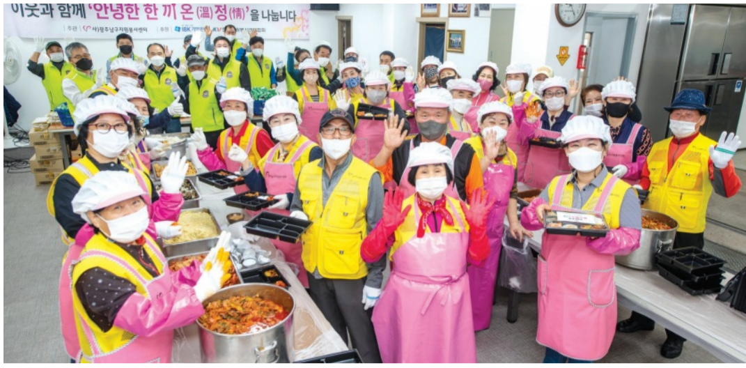
4일 광주시 남구 월산동 남구자원봉사센터 작업장에서 자원봉사자들이 어르신들에게 전달할 도시락을 만들며 환하게 미소짓고 있다.

남구 각 동 주민자치회에서도 콩나물 등의 식재료와 음료수 등을 기부해주는 등 이들의 봉사에 힘을 실어줬다.