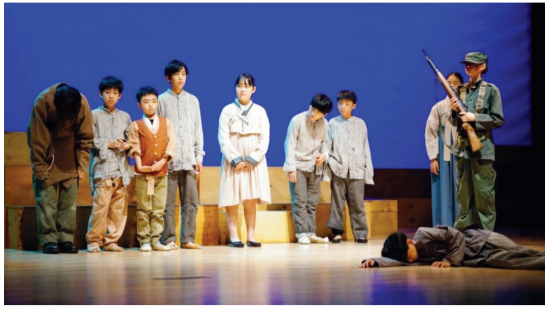
순천 송산초 학생들이 최근 순천만생태문화교육원 공연장에서 연극 ‘잊을 수 없는 과거’를 공연하고 있다.