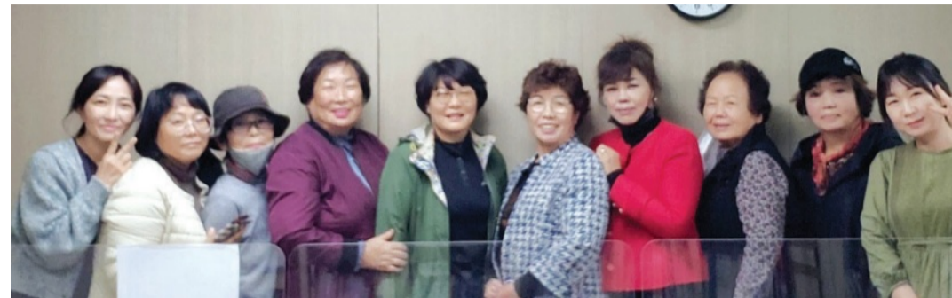
나주여성농업인종합지원센터 회원들과 전시회장(아래).

강 센터장은 “60~70대 나이를 먹고 붓을 든 손이 떨릴 떨리기도 했지만, 그림을 그릴때만은 환하게 웃곤 한다”며 “13일에는 각종 장비를 동원해 작품들을 전시장에 직접 설치하기도 했다. 농사만 짓던 사람들이 멋진 그림을 그려 전시회까지 열다니, 뿌듯