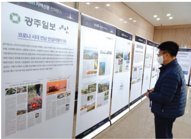
광주일보가 컨퍼런스에서 발표한 연재물 제목은 '코로나 시대 전남 안심 관광지 50선' (사진)이다.

광주일보가 컨퍼런스에서 발표한 연재물 제목은 '코로나 시대 전남 안심 관광지 50선' (사진)이다. 코로나 시대, 안전을 지키면서 자연에서 힐링할 수 있는 전남의 야의 관광지 50곳을 소개하는 내용이다. 목포 곶도 산책로, 진도 점도 웰빙길, 여수 하화도 꽃섬길, 고흥 속섬·연흥도, 국립나주숲체원, 장흥 전관산 동백생태숲, 장성 축령산 숲체원, 구례 천은사 소나무숲길·천개의향나무숲 등이다.