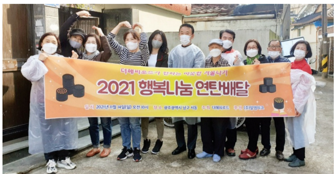
더해피로드(대표 해공 스님) 후원자들로 구성된 바리밀봉사단이 최근 광주시 남구 구동 골목에 있는 독거어르신 가구를 위해 연탄 300장을 배달하는 봉사활동을 진행했다. 더해피로드는 서거사에서 운영하는 봉사단체로 내팔·미안마 학생들에게 장학금을 후원하고 있다.