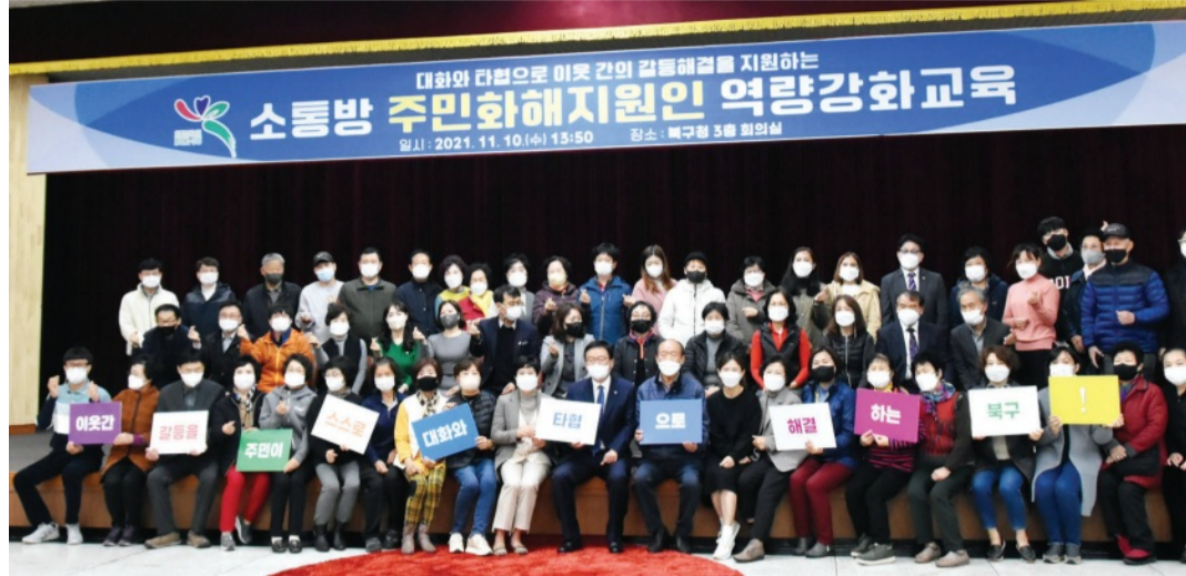
광주 북구 마을분쟁해결지원센터는 최근 북구청 대회의실에서 소통방 주민화해지원인 역량강화교육을 개최했다. 문인 북구청장과 주민화해지원인들이 마을 문제를 스스로 해결하고 공동체 문화를 회복하자는 다짐을 하고 있다.

또 75명의 주민화해지원인들은 2021년 광주시 운영 주민화해지원인 교육을 15시간 받았다. 이를 바탕으로 다양한 소통 프로그램 운영 및 회의를 통