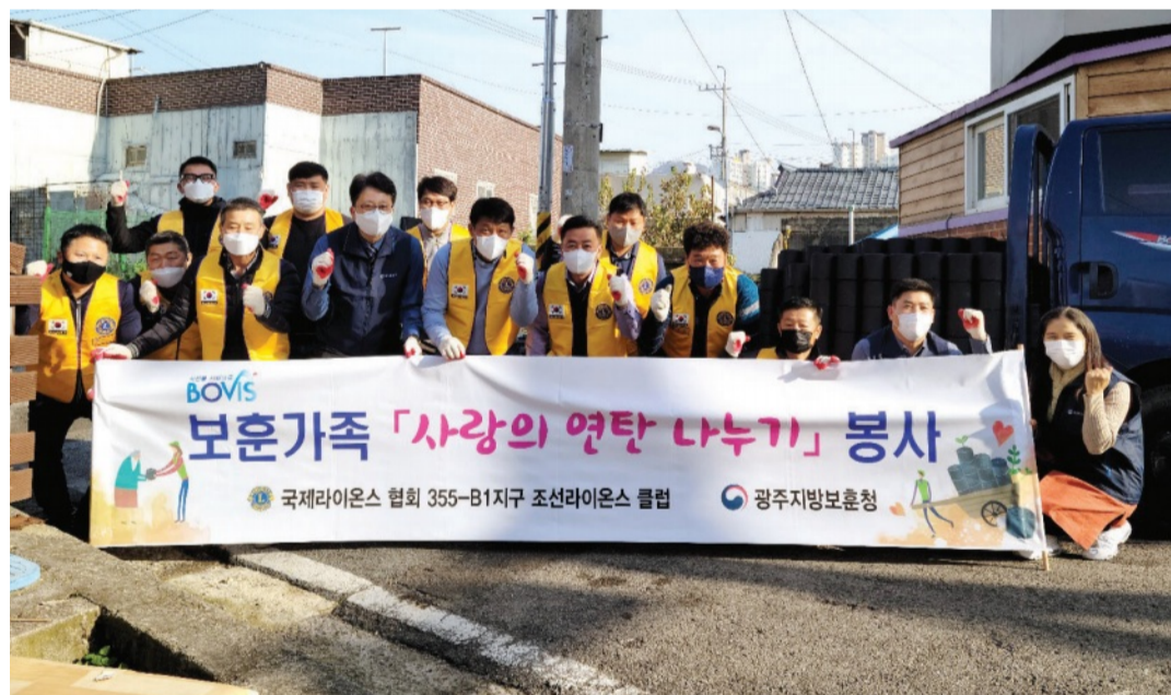
광주지방보훈청(청장 임종배)은 최근 조선라이온스클럽(회장 정경호)과 함께 생활이 어려운 보훈가족 5가구에 사랑의 연탄 1760장과 위문품을 전달했다.