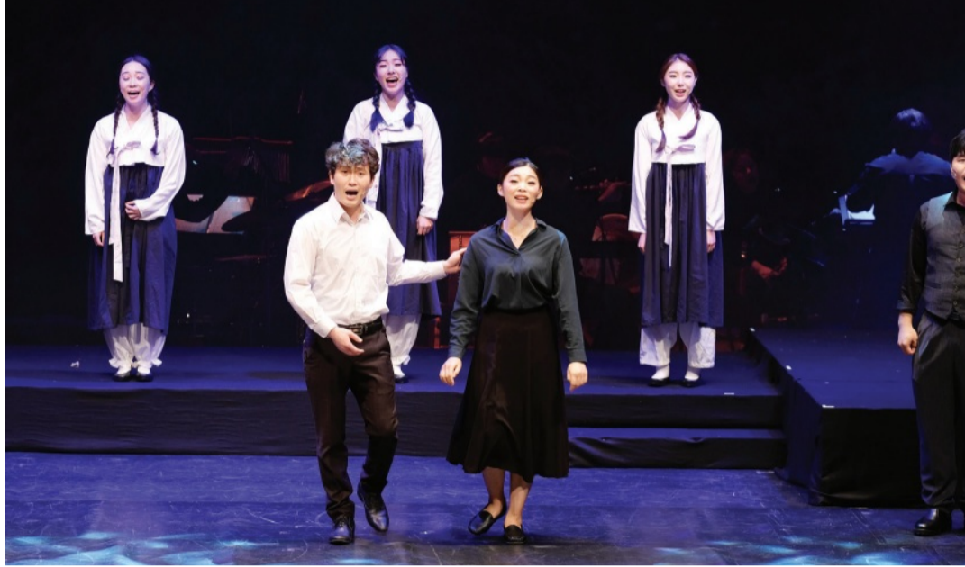
지난해 '빛고를 가얏고' 초연 당시 각인각색 단원들과 공연 관계자들.

월북하지 않았는데, 안기욱을 평생 스승이라고 부르지 못한 것이 한이었다고 한다. 이후 성금연도 1974년에 남편 지영희(시나위 예능보유자)와 함께 미국으로 이민을 떠나며 보유자 인정이 해제됐다. 유 대표는 "성금연 명인은 서울에 국악예술학교를 창립하고, 하와이에서도 후진 양성에 힘썼다. 안기욱 명인은 한국 첫 가야금산조인 김창조 산조를 오선지에 처음으로 옮겨 적기도 했다"고 설명했다. "서양에서 음악의 아버지·어머니는 바흐와 헨델이라 불리죠. 그런데 국악의 아버지·어머니는 누구죠? 국악 명맥을 이어 온 명인들 중 이름 말할 수 있는 사람이 없더라고요. 더 공부해서 성금연 명인뿐 아니라 더 많은 국악인들을 찾아내 그 업적을 알리고 싶어요." 각인각색은 지난 2012년 국악 실내악단체로 창단됐으나, 2015년 '국악 뮤지컬'로 활동 방향을 바꿨다. "관객들이 연주자의 실력에만 집중하는 게 싫었습니다. 누가 더 잘하는지 따지는 공연이 아니라, 장면과 사건을 돌아보고 주제를 느낄 수 있는 공연을 하고 싶었죠. '의미와 메시지가 있는 공연'을 하