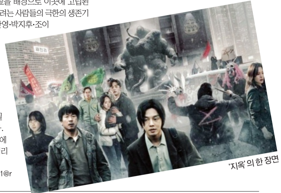
'지옥'의 한 장면