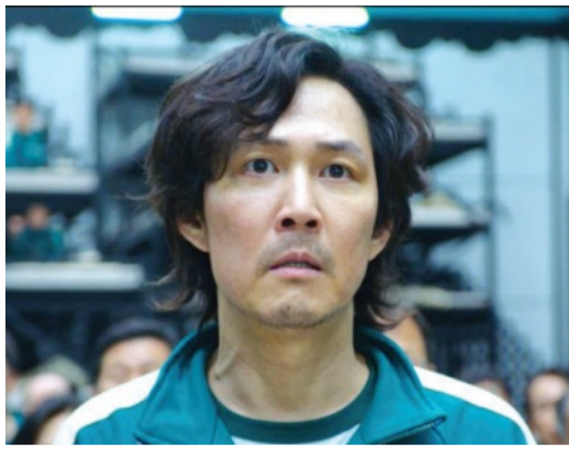
'오징어게임'에 출연한 이정재