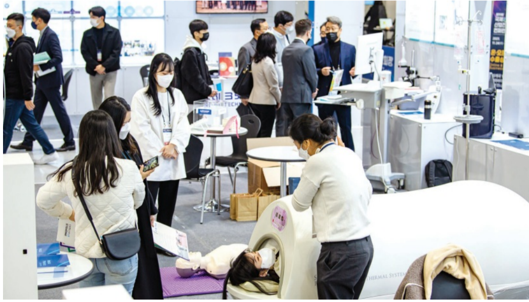
2021 국제광융합산업전시회가 24일 광주 서구 김대중컨벤션센터에서 개막했다. 전시장을 찾은 시민들이 광산업 관련 제품들을 관람하고 있다.

24~25일 김대중컨벤션센터 광융합 신기술·제품 한자리 국내 100여개 업체·16개 기관 20개국 바이어 150여명 참가 일자리 박람회·수출 상담도