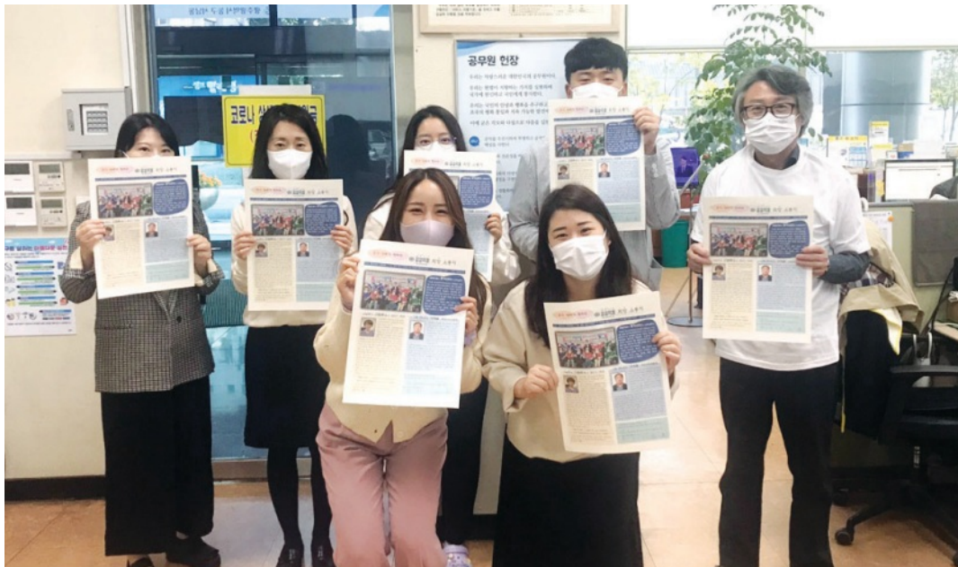
서남동 마을기자단이 마을신문을 들어 보이고 있다.

학동 마을기자단 13명은 당산나무협의회를 주축으로 모였다. 학동은 지난해 ‘동구 우리마을 자랑대회’에서 최우수상을 받은 시상금으로 ‘학동 마을소식지’를 창간했다. 기자단은 지난 6월부터 10월까지 4개월 동안 기획·취재·편집을 진행해 지난 1일 창간호 1000부를 펴냈다. 남광주시장 새벽 풍경, 팔거리 골목, 종갓거리를 비롯한 학동의 풍경 및 역사자원을 글과 사진으로 남기고 오래된 가게 ‘서울