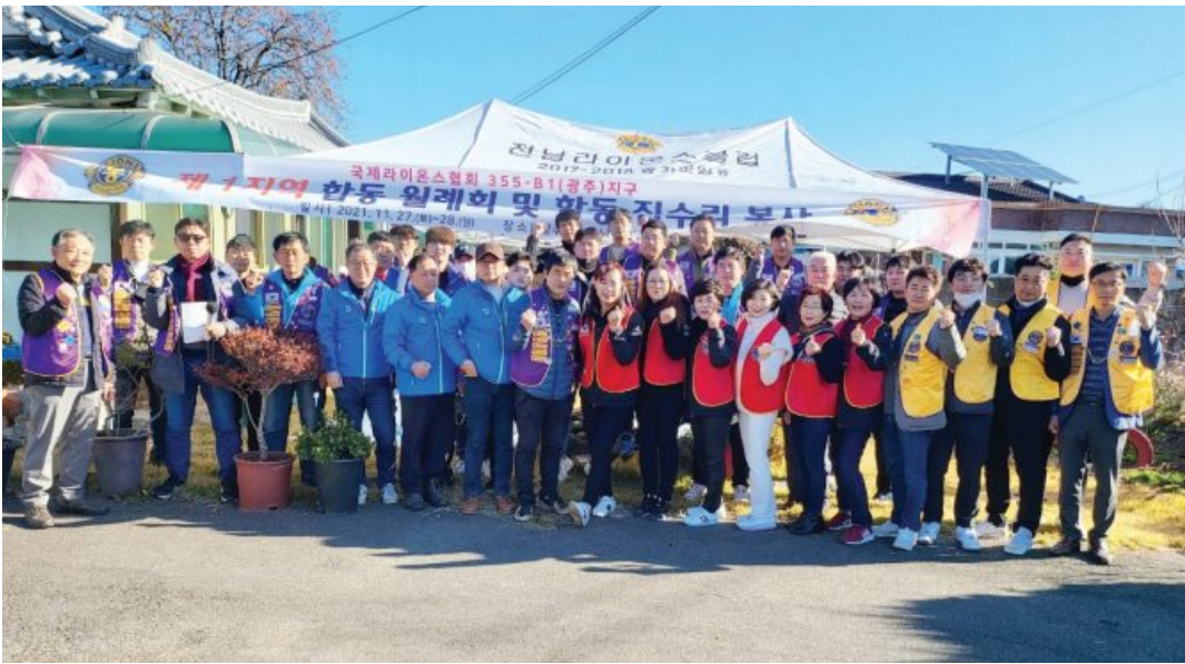
국제라이온스협회 355-B1(광주)지구 제1지역클럽 회원들이 최근 광주시 남구 대촌동에 있는 소외계층 가구에서 1500여만원 상당 합동 집수리 봉사를 진행했다.