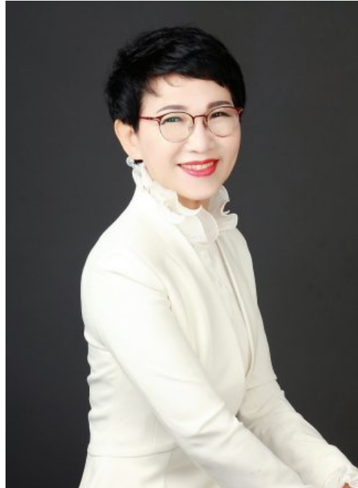
아이가 거금이 드는 양약 수술을 앞두고, 텅 빈 잔고를 보고 안 대표는 깨달음을 얻었다.

아이에게서는 대학 등록금이냐 입학비를 내 달라는 등 가끔씩 연락이 왔다. 이전에 벌었던 돈에서 떼어 송금을 해 주는 나날이 반복됐다. 지난 2017년께