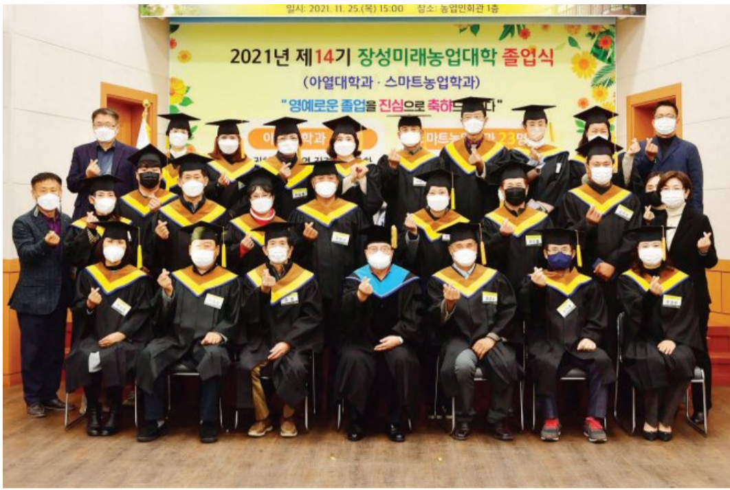
1년 간의 교육과정을 마친 제14기 장성미래농업대학 졸업생들이 기념촬영을 하고 있다.

여기에 4차산업 시대 농업경쟁력 향상을 위해 스마트농업학과를 개설하고 청년 농업인을 중심으로 스마트팜 활용과 친환경 농업 실천을 위한 전문교