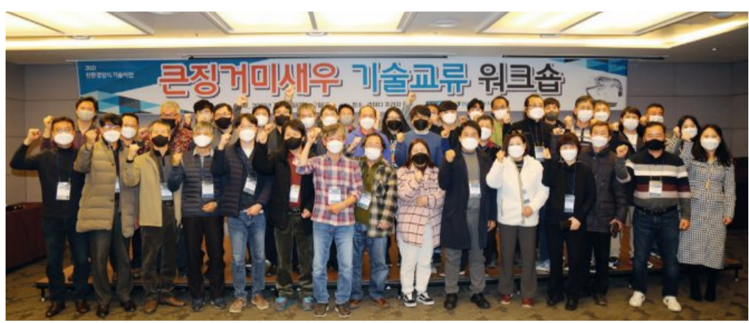
전남어촌특화지원센터가 주최하고 해양수산부, 한국어촌어항공단이 후원한 ‘큰징거미새우 기술교류 워크숍’이 지난 3일부터 1박 2일간 광주 리미다호텔에서 열렸다. 워크숍에는 지난 2017년부터 센터가 진행한 기술이전교육, 창업지원컨설팅을 받은 전국의 교육이수자 100여 명이 참석했다.