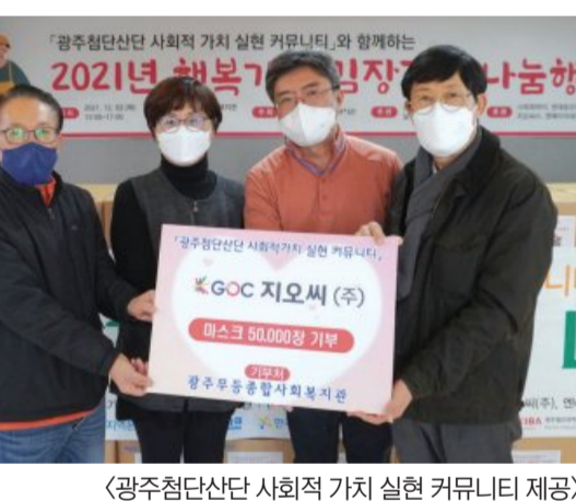
산한 덴탈마스크 5만장도 함께 후원했다.

광주첨단과학국가산업단지 사회적가치 실현 커뮤니티는 최근 김장김치 나눔 행사를 진행했다. 해당 커뮤니티는 사회적가치 서비스 제공을 위해 첨단산단 내 14개 유관기관·단체가 협력체계를 구축, 매달 사회공헌활동을 추진 중이다. 이날 커뮤니티에 참여하는 기관·단체들은 광주시 김장대전을 통해 식품안전관리(HACCP) 인증과 전통식품 품질인증 받은 지역 업체에서 김장 재료를 구매해 1200kg의 김장김치를 직접 담갔다. 이번엔 만든 김치는 광주부 등종합사회복지관을 통해 지역 내 취약계층 가정 240세대에 전달됐다. 또 지역기업인 지오씨가 생