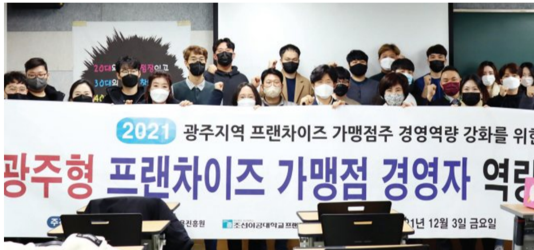
조선이공대학교(총장 조순계)와 (재)광주시경제고용진흥원(원장 나성화)이 공동으로 최근 '2021 광주형 프랜차이즈 가맹점 경영자 역량강화 교육'을 가졌다.