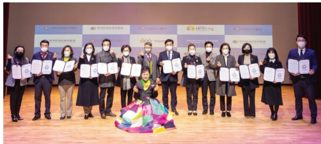
한국인성교육진흥 대상 시상식이 14일 광주 남구문화예술회관에서 열렸다. 한국문화복지협회와 경실련이 주최하고 한국인성교육진흥원이 주관한 이날 행사에서 인성교육 확산과 지역봉사에 공헌한 지역민 50명이 수상했다.