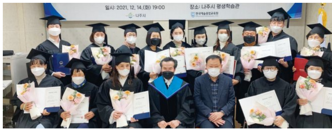
나주시는 지난 14일 '제5기 평생교육사 양성과정 수료식'을 열고 평생교육 활동가 15명을 배출했다. 학점인증 교육기관인 한국예술종합교육원(학장 김영미)에 위탁해 40주간 실시한 이번 교육에서는 수료생 전원이 평생교육사 2급 자격증을 취득했다.