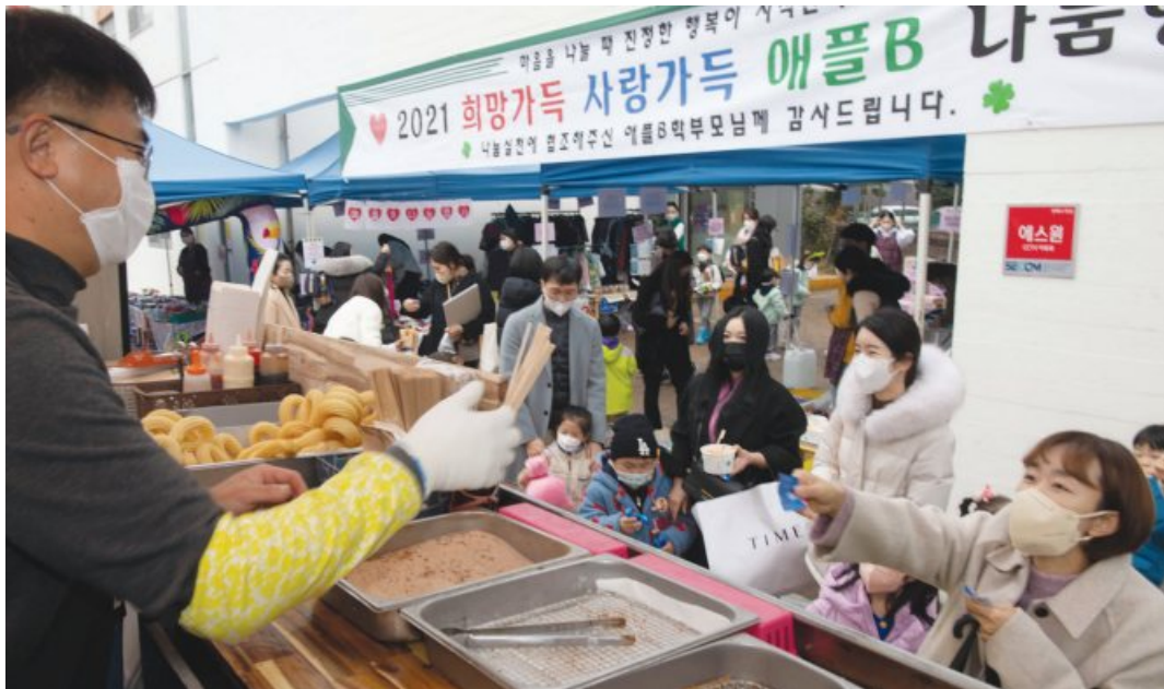
16일 광주시 동구 용산동 애플B유치원에서 열린 '희망가득, 사랑가득 애플B 나눔행사'에서 학부모와 어린이들이 물건을 고르고 있다.