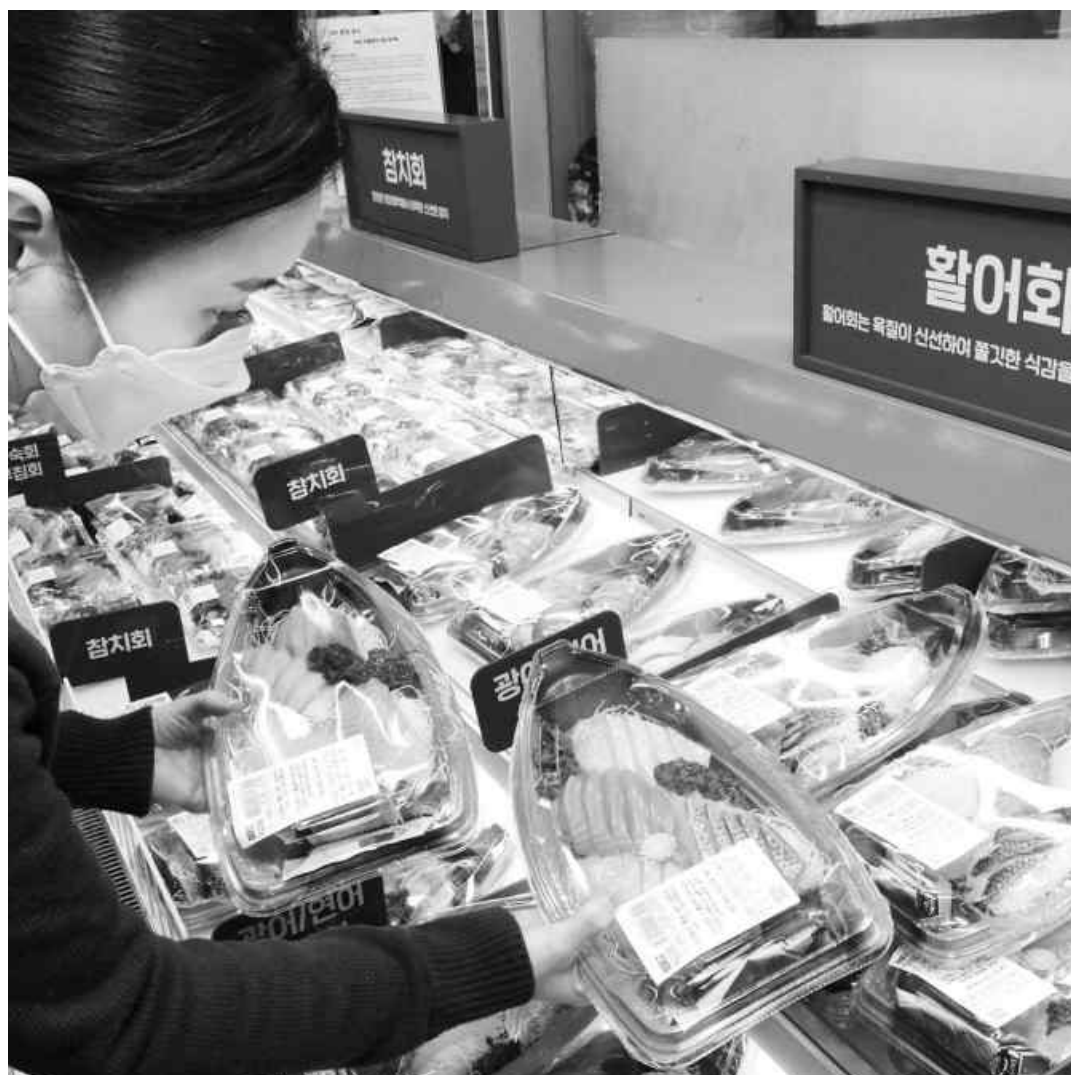
‘홍술’ 안주는 활어회로 이마트 식품매장 생선회 코너에서 고객이 활어회 제품을 살펴보고 있다. 이마트는 코로나19 여파로 인한 ‘홍술’ 등 문화로 생선회 매출이 크게 증가함에 따라 신세계포인트 회원들을 대상으로 오는 22일까지 청어 과메기회와 콩치 과메기회를, 23~29일에는 눈다랑어 모듬회와 참돔겹질 모듬회를 할인 판매한다.