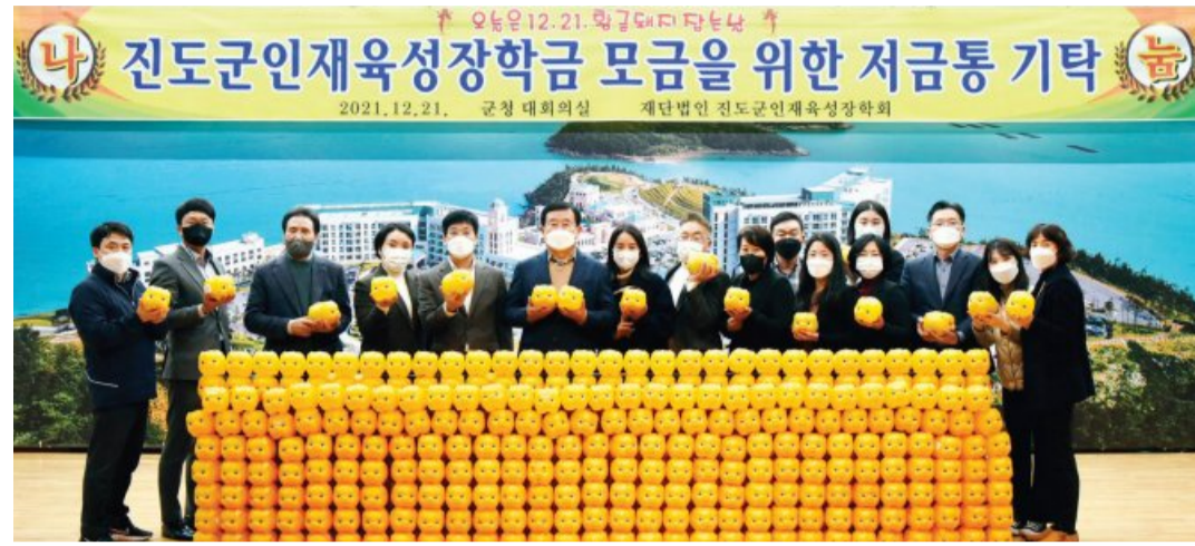
진도군과 진도군 인재육성장학회 관계자들이 진도군민들이 보내 온 533개 황금돼지 저금통을 들어 보이고 있다.