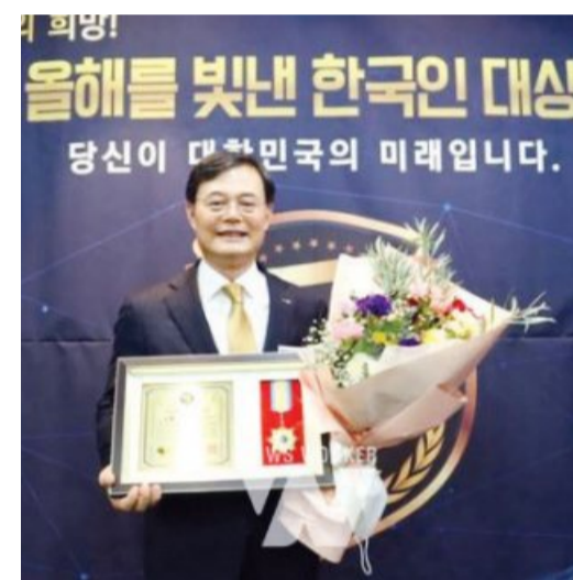
소리에 귀 기울여 기존 복지현장의 변화와 혁신을 위해 더욱 노력하겠다”고 밝혔다.