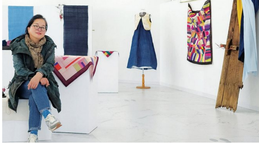
심향란 한국천연염색 숲 대표와 녹차, 쪽, 삼베 등을 활용해 만든 천연 염색 제품들. <전남도 제공>

외부에 맡기지 않고 유통단계를 줄여 타 천연염색 제품 대비 가격을 최대 3분의 1 수준으로 낮췄다. 소비자에게 우리나라 고유 색감을 입힌 옷의 아름다움을 알리기 위해 지난 4년간 보성에서 패션쇼를 열었다. 코로나 발생 전 2019년에는 1000명이상이 패션쇼와 함께 작은 음악회 등을 관람하기 위해 방문했다. 영상은 유튜브 '보성천연염색공예관 숲' 채널에서 확인할 수 있다. 심 대표는 준비된 재료를 활용해 누구나 손쉽게 천연염색 제품을 만들 수 있는 천연염색 마스크 만들기, 녹차베개 만들기 등 꾸러미 체험키트도 개발했다. 전남도가 운영하는 온라인 쇼핑몰 남도장터(jmall.kr)에서 구입할 수 있다. 또 '보성군 천연염색공예관'을 위탁받아 체험 프로그램을 운영하면서 전문인력을 양성하는 등 천연염색 확산에 앞장서고 있다. 올해는 설립 6년 만에 원피스, 스카프, 녹차베개 등 50여 종의 전통천연