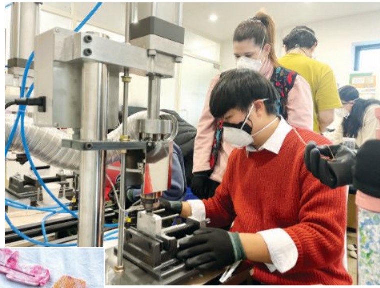
▶발산마을 청년들이 플라스틱 병뚜껑을 가공하고 있다. 아래는 제품 사진.

리, 고양이 모양 튜브 자개 등 3종이다. 일상 생활에서 나오는 병뚜껑을 모아서 가져가면 재활용 가능 여부를 알려주고, 수거한 무게만큼 쿠폰을 적립해 주기도 한다. 제품은 발산마을 입구 ‘청춘빌리지’에서 상시 판매하며, 내년부터는 온라인 판매도 시작할 계획이다. “서울에서는 ‘플라스틱 방앗간’ 등 병뚜껑 재활용 공간이 많이 있는데, 광주에는 아직 없더라고요. 지난해부터 기획해서 분쇄기와 사출기, 금형 등 장비를 구입하고, 청년들도 사출 시 온도 조절 등 기술을 익혔습니다.” 정류장은 발산마을 8명 조합원을 비롯해 뜻에 동참한 청년 12명이 운영하고 있다. 발산마을에 거주 중인 어르신들도 인건비를 받고 병뚜껑 세척·건조 및 분류에 도움을 주고 있다. 송 대표는 추후 노인 일자리와 연계해 어르신과 청년이 함께 일하는 공간으로 발전시킨다는 계획도 갖고 있다. 발산마을 청년들은 “플라스틱 정류장이 마을뿐