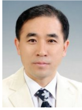
조선대병원 영양집중지원위원회 위원장을 역임하면서 환자 영양 평가 및 지원 방법 등의 치료 계획 관리를 통해 환자 합병증 예방과 지속한 질병 회복에 힘썼으며, 한국정맥경장영양학회에서 실시하는

장, 교육연구부장, 대외협력실장, 암센터장 등 주요 보직을 두루 거쳤다. 김 병원장의 전문분야는 대장·항문외과로 조선대병원 대장암 다학제팀을 이끌면서 건강보험심사평가원에서 실시하는 주요 암치료 평가 중 대장암 수술 평가 1등급에 선정되는데 크게 기여했다. 특히 대장암의 발생·진행 등에 관한 기초연구 부문에 다수의 우수 논문을 발표하는 등 연구 업적을