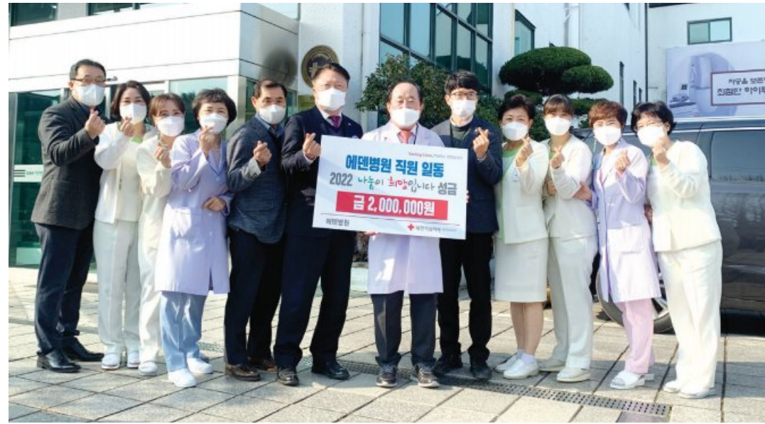
에덴병원이 최근 어려운 이웃을 위해 써달라며 직원 100여명이 십시일반 모은 이웃돕기 성금 200만원을 대한적십자사 광주전남지사(회장 허정)에 전달했다.