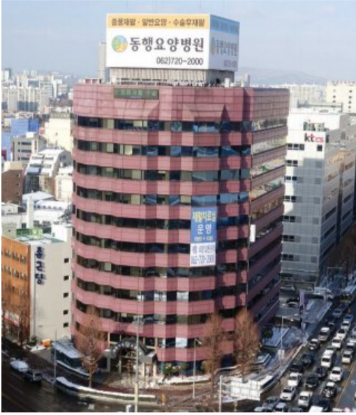
광주시 북구 신안동 병원 전경.

동행재활요양병원 DongHaeng Convalescent Hospital