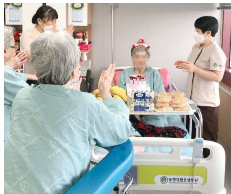
병원 임직원들은 매일 어르신 생신 잔치를 열어 건강을 기원하고 있다.