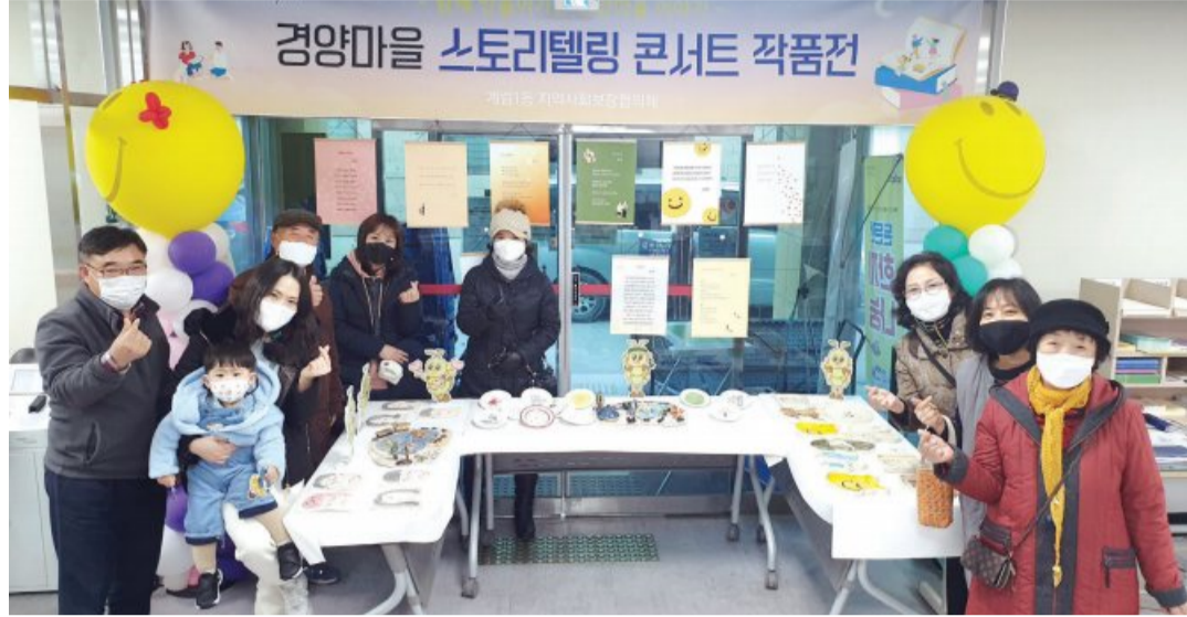
계림1동 지역사회보장협의체 회원을 비롯한 계림동 주민들이 계림1동 행정복지센터에서 '우리 동네 경양마을 이야기' 전시회를 열고 있다.