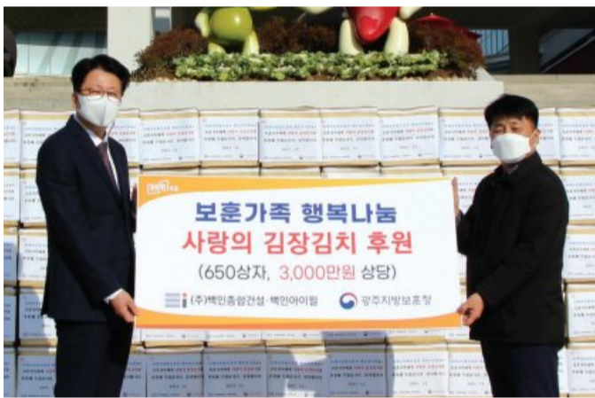
찬 등 총 1억 4000만원 상당의 후원물품을 지원했으며, 보훈가족을 위한 사회공헌활동에 지속적으로 참여해오고 있다.