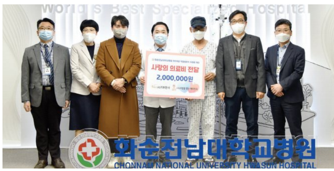
광주-전남지역 봉사단체인 사단법인 '기부천사'와 '사랑을 맺는해피트리'가 최근 가정형편이 어려운 환자의 의료비 지원을 위해 각각 100만원씩 총 200만원을 화순전남대학교병원(병원장 신명근)에 기탁했다.