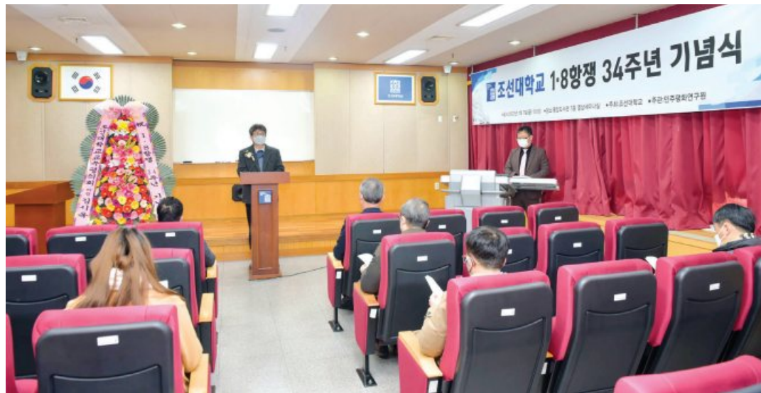
조선대학교가 최근 대학 중앙도서관 영상세미나실에서 설립 역사를 되찾고 대학의 민주화를 이룩한 조선대 1·8항쟁 34주년 기념식을 개최했다. 조선대는 기념식에 앞서 1·8항쟁 기념비 앞에서 한화식을 열었다. (조선대 제공)