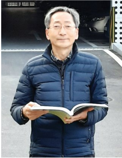
식이나 손자들에게 인생의 가치관을 전해주려는 어르신들을 볼 때면 보람을 느낍니다. 아울러 동양 고전을 공부하다 보면 가족들과의 소통, 공감 능력도 향상되거든요.” 이 강사는 지금까지 한자·한문 전문지도사 훈장

에서 경영학을 공부하고 대학원은 전남대 한문고전번역과정에서 공부했다. 이 강사는 “그동안 한자와 한문은 현대에 뒤떨어진 구시대적이며 낡은 사상으로 치부된 적도 있다”며 “그러나 지금은 중국이 G2 강국으로 부상하며 한문과 동양 인문학의 가치가 높아졌다”고 말했다. 어르신들을 가르치면서 드는 생각 가운데 하나는 배움의 중요성이었다. “실버세대 문화포격을 높이고 치매를 예방하기 위해서는 뭔가를 배우는 것만큼 효과가 큰 것은 없다”는 사실이다. 그가 복지타운에서 가르치는 주 내용은 논어, 채근담, 중국고전 148구 등이다. 수업을 하면서 어르신들이 한문과 인문학에 대한 관심이 높다는 것을 느낀다. 대부분 70-80대로 공직에 있다 퇴임을 한 어르신들은 삶에 대한 지혜가 풍부하며 배움에 대한 열망도 크다. “한문, 사자성어 등 한 구절이라도 더 암송해 자