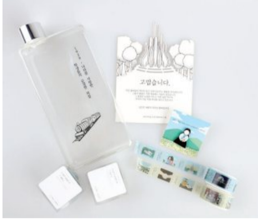
ABC마케팅이 제작한 북보틀(왼쪽부터), 배지, 마스크티이프.