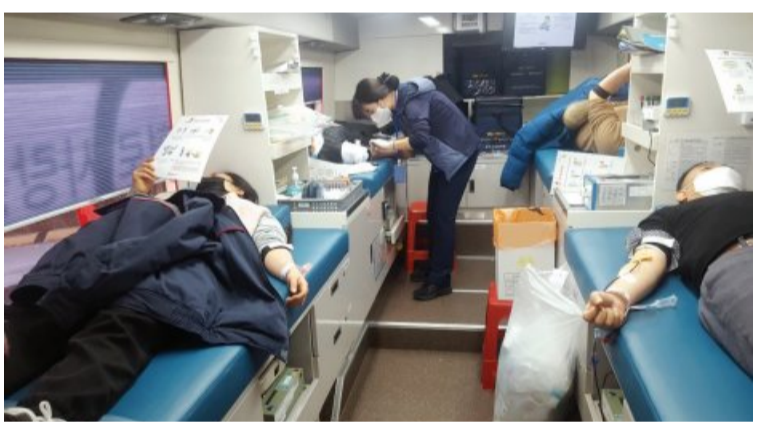
쌍용차 충청지역본부장은 “코로나19 장기화로 인한 국가적 혈액수급 위기가 하루 빨리 극복됐으면 한다”며 “앞으로도 지역사회의 어려움을 외면하지 않고 함께 극복하기 위해 기업의 사회적 책임을 다하겠다”고 말했다.

광주·나주지역 쌍용자동차 판매대리점 및 정비 네트워크 임직원들이 12일 릴레이헌혈 운동에 동참했다. 쌍용자동차는 최근 코로나 19 장기화로 인한 혈액 수급난 해소를 위해 충청·호남권에서 릴레이 헌혈 활동을 하고 있다. 3일 충청남 지역본부를 시작으로 홍성(7일), 광주·나주(12일), 서산(13일) 등 지역 판매대리점 및 정비사업소 직원 500여명이 참여했다. 개인별 헌혈증은 충청남지역 대리점 협의회장이 수합해 일괄적으로 대한적십자사에 기부할 계획이다.