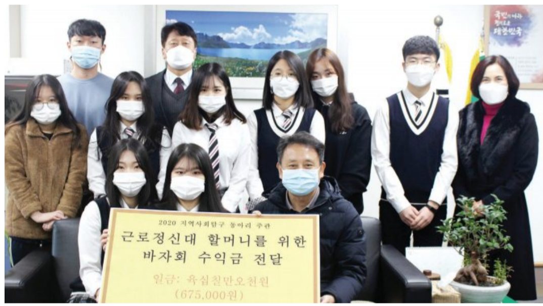
로 어떻게 수 있었느냐”며 “지역사회에서 관심 있게 이 사안을 지켜보는 사람들이 있다는 것에 더 할 수 없이 큰 힘을 얻는다”고 고마움을 표사했다.