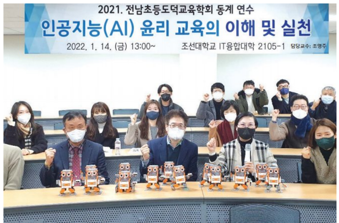
호남 최초 소프트웨어중심대학인 조선대학교 SW중심대학사업단이 최근 전남지역 초등학교 교사를 대상으로 한 ‘2022년 전남 초등 도덕교육학회 동계 교원 연수 프로그램’을 성황리에 마무리 했다.